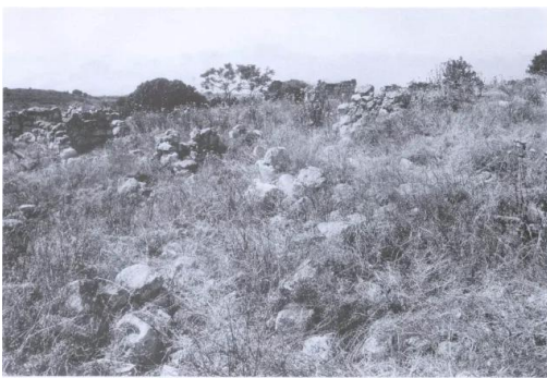
موقع قرية حوشة (جنداء)، وتظهر فيه بقايا القرية. المشهد كما يبدو للناظر من الشرق إلى الغرب. (أيار مايو ١٩٩٠)