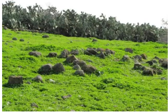
عولم: موقع القرية واثار بيوتها