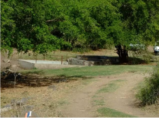
قرية عولم المهجرة