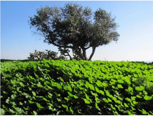
عولم: موقع القرية مغطى بالاعشاب