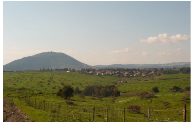
عولم: بالقرب من القرية