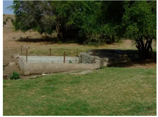
قرية عولم المهجرة