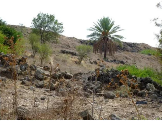
قرية عولم المهجرة