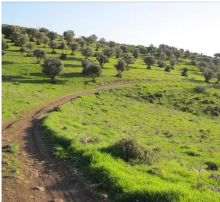
عولم: زيتون عولم