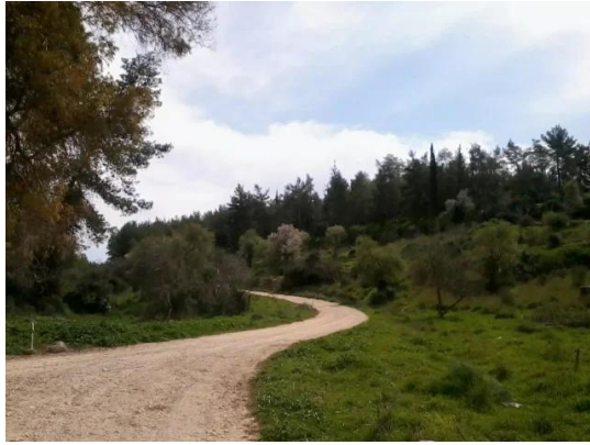
دير أيوب: جولة في حقول وكروم زيتون دير ابان المهجرة