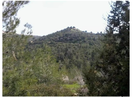
دير أيوب: جولة في حقول وكروم زيتون دير ابان المهجرة