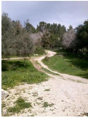
دير أيوب: جولة في حقول وكروم زيتون دير ابان المهجرة