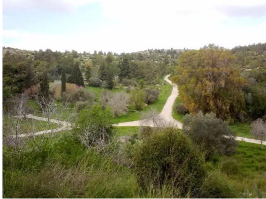
دير أيوب: جولة في حقول وكروم زيتون دير ابان المهجرة