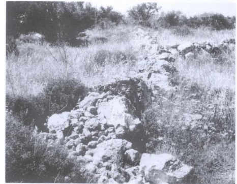
بقايا سياجات حجرية (أيار/ مايو ١٩٨٧) [دير أيوب] الصور: كمال دير أيوب: أطلال بيوت القرية المدمرة، أنقر الصورة لتكبيرها. 1987