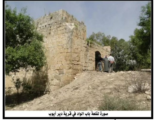
دير أيوب: القلعة في دير أيوب