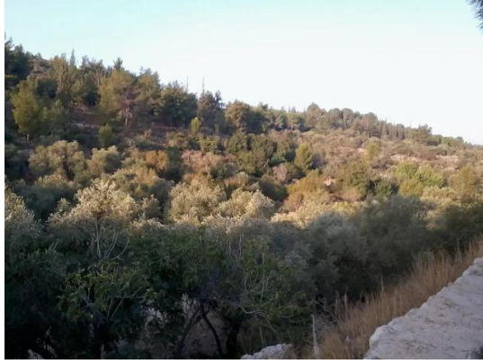
دير أيوب: جولة في حقول وكروم زيتون دير ابان المهجرة