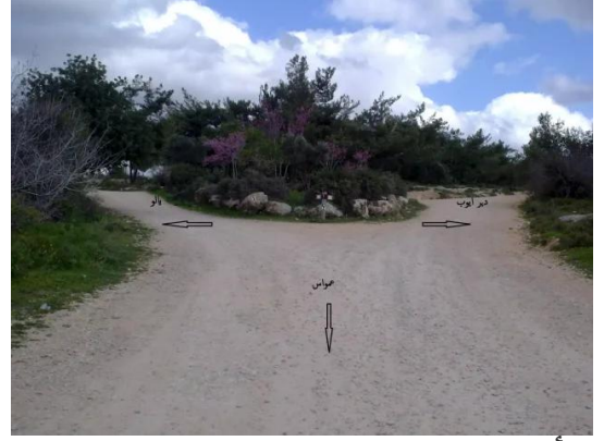
دير أيوب: جولة في حقول وكروم زيتون دير ابان المهجرة