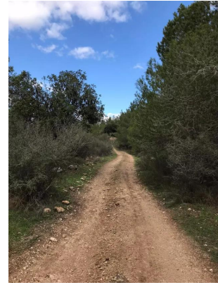
دير أيوب: جولة في ربوع واحراش وبراري قرية دير أيوب المهجرة