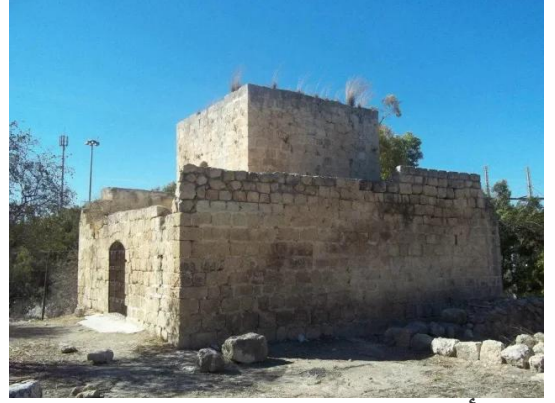
دير أيوب: انقاض بيوت دير ابان المدمرة