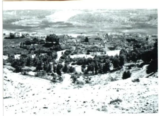
دير أيوب: صورة نادرة للقرية في منطقة الحرام ويبدو أن القرية لم تدمر في ذلك الوقت. 1965