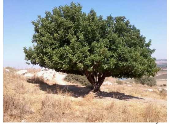
دير أيوب: جولة في حقول وكروم زيتون دير ابان المهجرة