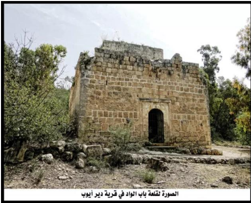
دير أيوب: القلعة في دير أيوب