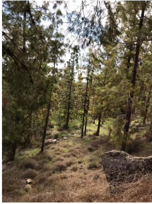
دير أيوب: جولة في ربوع واحراش وبراري قرية دير أيوب المهجرة