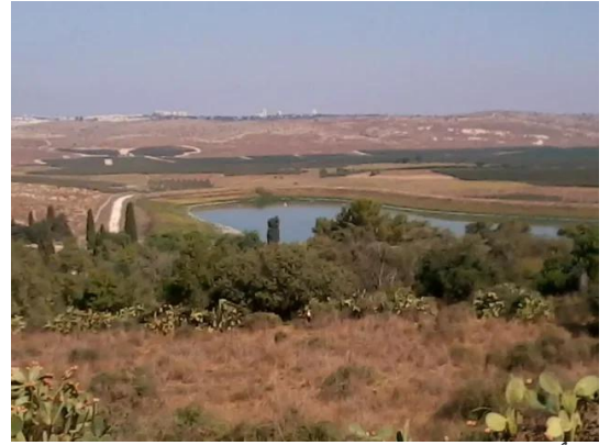
دير أيوب: جولة في حقول وكروم زيتون دير ابان المهجرة