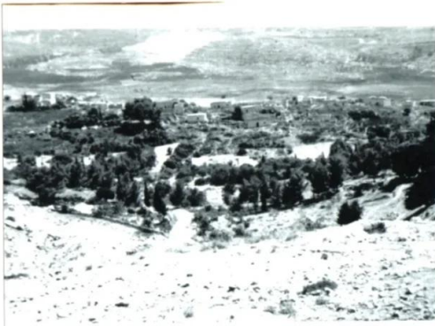
دير أيوب: منظر عام لقرية دير أيوب قبل النكبة