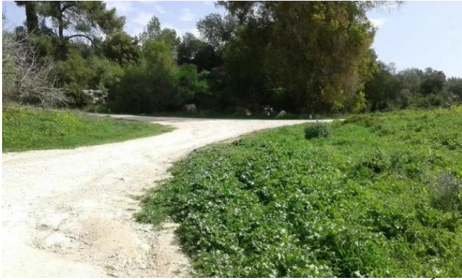
دير أيوب: جولة في حقول وكروم زيتون دير ابان المهجرة