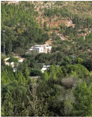
دير أيوب: منظر من دير أيوب