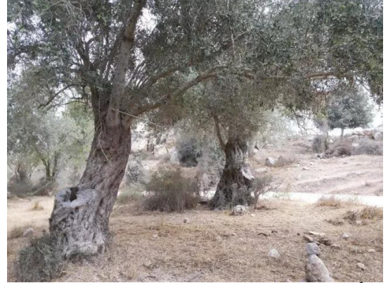
دير أيوب: جولة في حقول وكروم زيتون دير ابان المهجرة