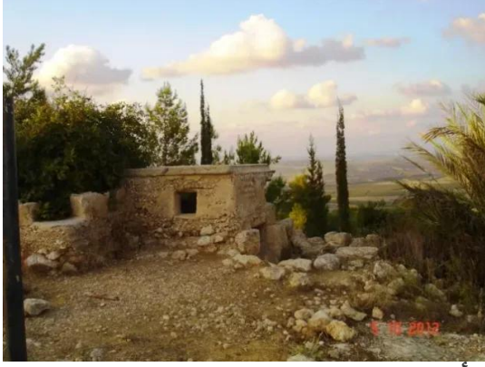
دير أيوب: استحكامات الجيش العربي قرب القرية