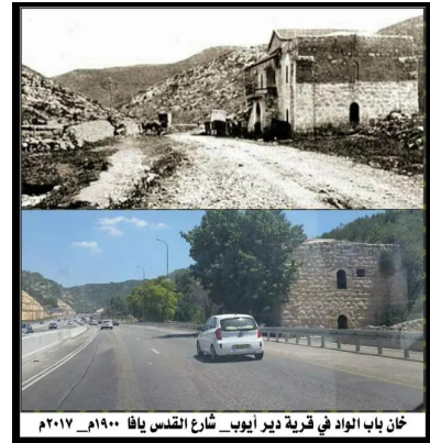
دير أيوب: خان باب الواد في دير أيوب قبل وبعد التهجير