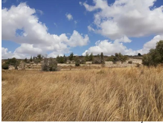
دير أيوب: انقاض بيوت دير ابان المدمرة