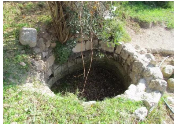
دير أيوب: أبار دير أيوب المتبقية