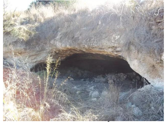
دير أيوب: مغارة عليان