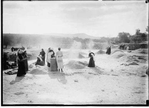
بيت نبالا: الحصاد و الدرأس والبيدر في فلسطين.