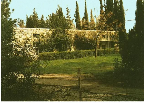
مدرسة بيت نبالا الأثر الوحيد الباقي للبلده بيت نبالا: مدرسة القرية المغتصبة، 2002