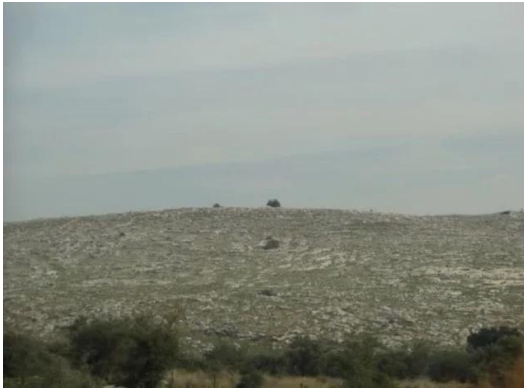
بيت نبالا: بالقرب من القرية