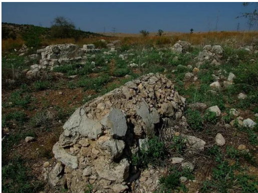
بيت نبالا: مقبرة القرية