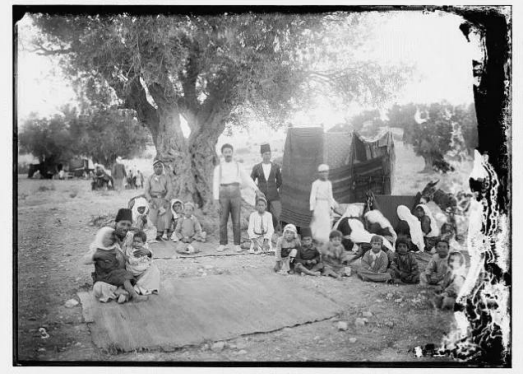
بيت نبالا: نازحون تحت الزيتون