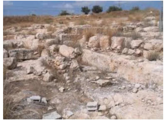
بيت نبالا: بقايا بيوت القرية