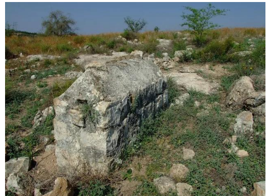
بيت نبالا: مشهد آخر لمقبرة القرية