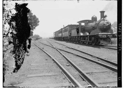
بيت نبالا: Train in Palestine 1920 / احد القطارات على السكة الفلسطينية 1920