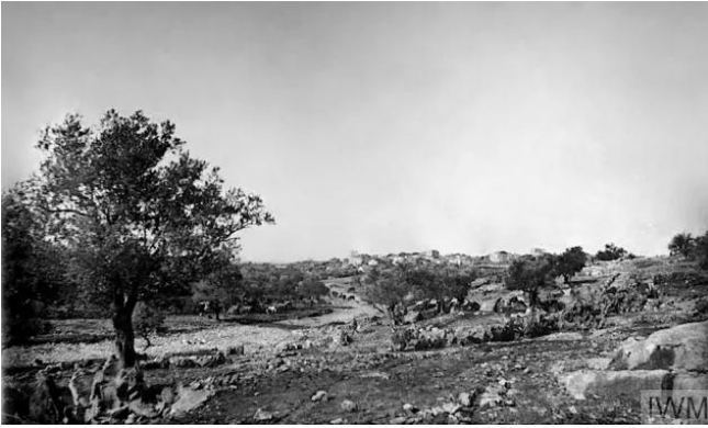
بيت نبالا: منظر عام لبيت نبالا قبل النكبة - 1918