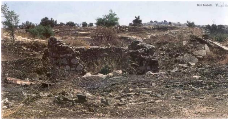
بيت نبالا: أطلال بيوت القرية المدمرة