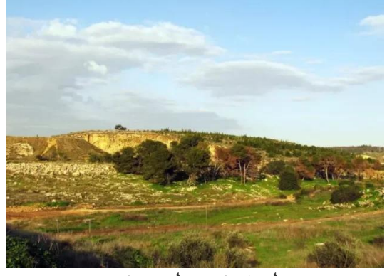
طيرة دندن: طيره دندن