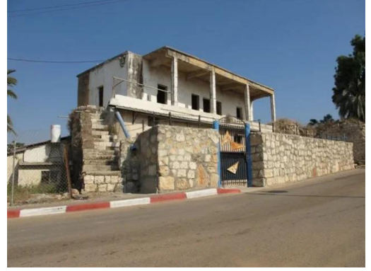
طيرة دندن: البيوت المنهوبة