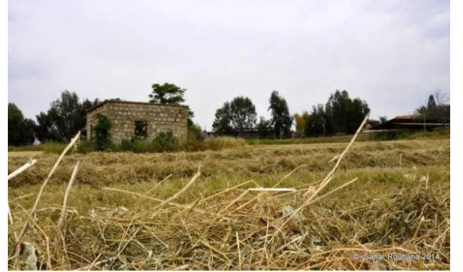
طيرة دندن: بيوت طيرة دندن المنهوبة