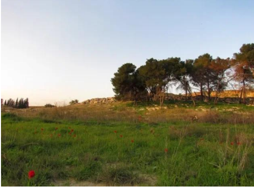
طيرة دندن: طيره دندن