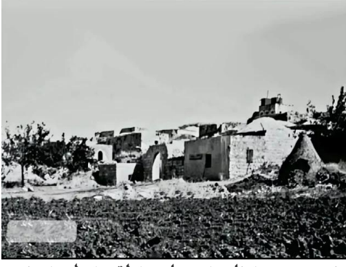
طيرة دندن: صورة نادرة وساحرة لقريّة طيرة دندن قضاء الرملة أربعينيات القرن العشرين..