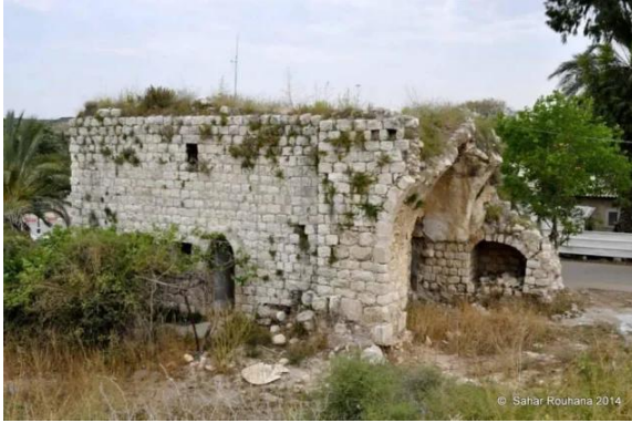
طيرة دندن: بيوت طيرة دندن المنهوبة