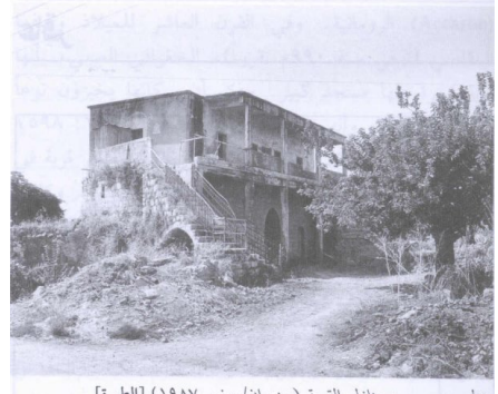
منزل مهجور من منازل القرية (حزيران/ يونيو ١٩٤٨) [الطيرة]