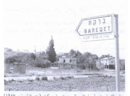
موقع القرية وفيه لوحة تشير إلى مستعمرة بريكث (حزيران/ يونيو ١٩٤٨) [الطيرة]

طيرة دندن: صورته قديمه لقرية طيره دندن بعد احتلالها