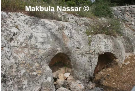
كفر عنان: اشكال صخرية عند مدخل القرية - 5.4.08