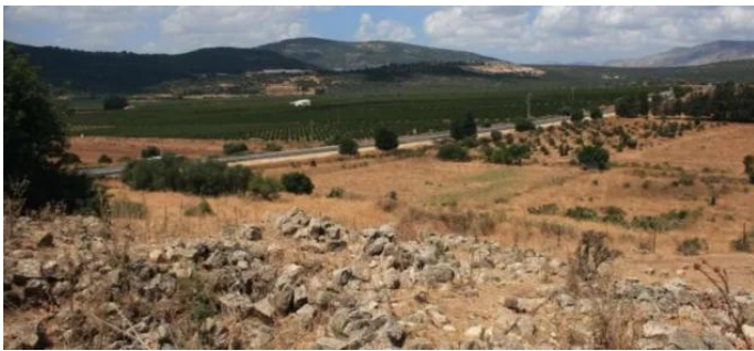
كفر عنان: منظر من القرية باتجاه الجنوب