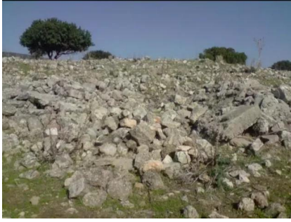
كفر عنان: ردم بيوت القرية