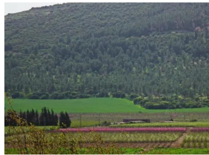
كفر عنان: اراضي قرية كفر عنان