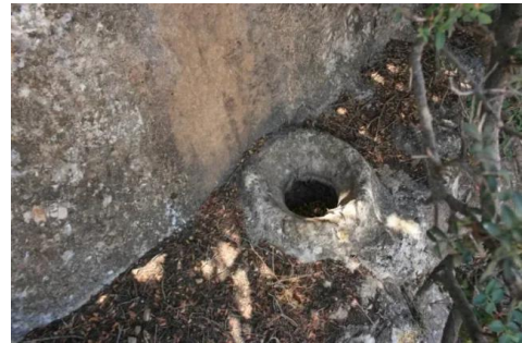
كفر عنان: جرن قديم جدا استعمله اهل القرية لتخزين الطعام او دقه 2009 8