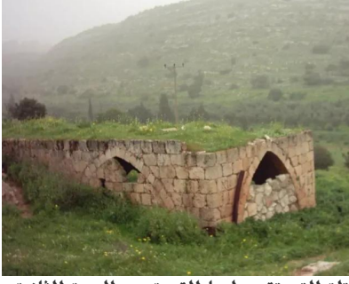
كفر عنان: التلة التي تقع عليها القرية من الجهة الثانية و تظهر خلفية المبنى المتبقى من بيوت القرية والمبين في الصورة السابقة - الصورة من الجهة الغربية 2003