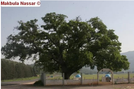
كفر عنان: قرية كفر عنان المهجرة – بطمة كفر عنان لا تزال شاهقة بجوار أحد المقامات المقدسة لدى اليهود، 3.4.09