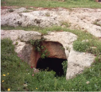
كفر عنان: أحد المغر ( ذات عدة مداخل لكنها متصلة من الداخل )تقع خلف المبنى في الصورة السابقة 2003