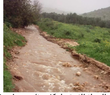
كفر عنان: مياه الرميطة التي تصل كفر عنان من وادي فراضية 2003