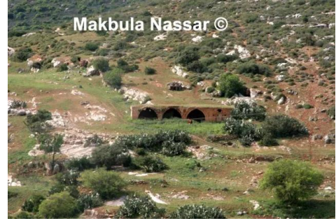
كفر عنان: بيت عائلة سعد - تصوير مقبولة نصار - 5.4.08