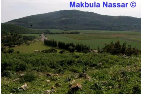
كفر عنان: اراضي القرية من ناحية قرية المغار - تصوير مقبولة نصار - 5.4.08