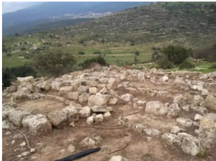
كفر عنان: مقبره القرية