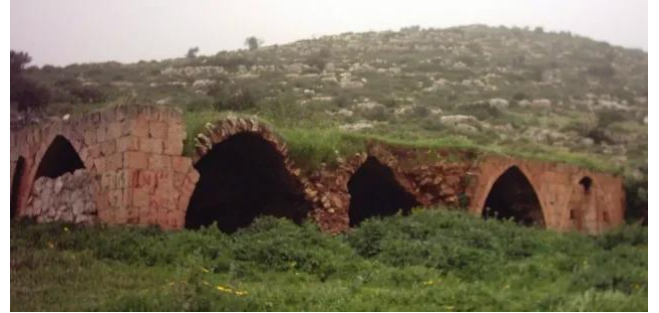
كفر عنان: مبنى من بيوت كفر عنان، يقع على التلة المقابلة لموقع القرية الاصيلي , يستعمل حالياً كزريبة للابقار وتقع خلفه مباشرة مجموعة من المغر. 2003