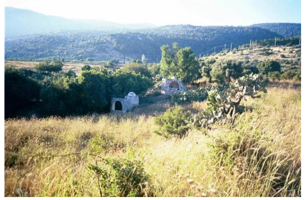
قرية الفراضية المهجرة