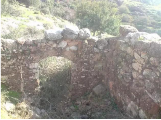
الفراضية: بقايا أحد بيوت القرية