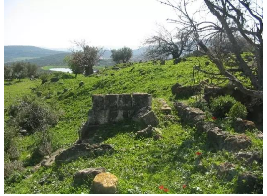
الفراضية: بعض الاثار الباقية في القرية - 28/2/2005