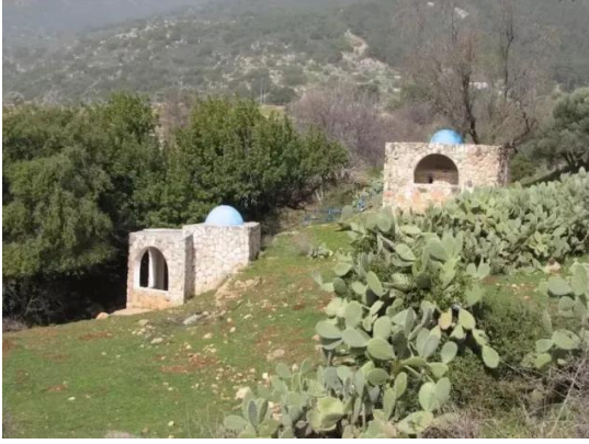
الفراضية: احدى الماقامات في فراضيه