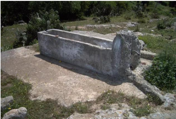
الفراضية: مقبرة القرية , أحد القبور الواضحة (خشخاشة) 2003