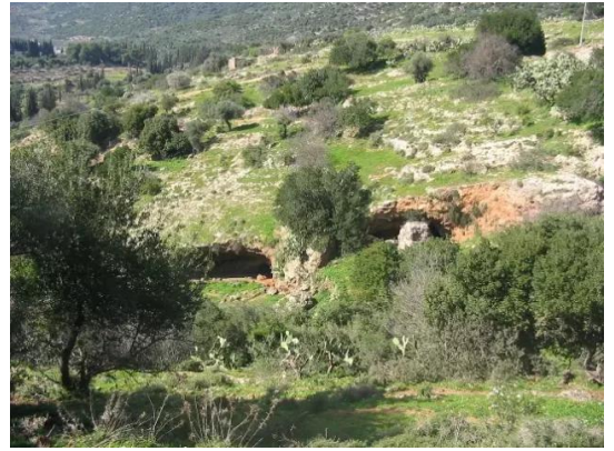
الفراضية: منحدر المياه في الطريق الى كفر عنان يمر بجانب مجموعة من المغر في الناحية الغربية - 28/2/2005