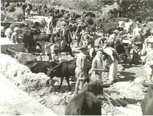
الفراضية: جنود بريطانيين يستحمون في عين فراضيه سنة 1941