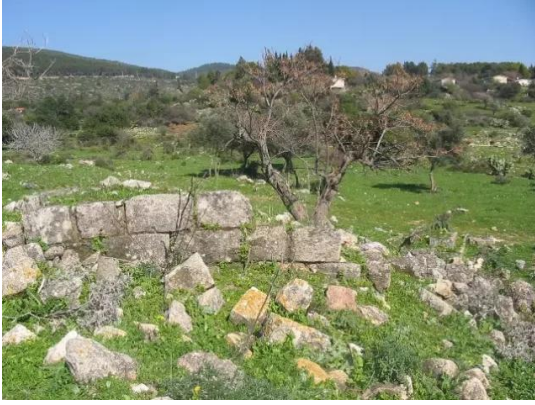
The remains of one of the houses: الفراضية: بقايا on the western edge of the village أحدى البيوت المطلة على السهل في الجهة الغربية