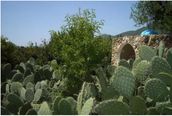
الفراضية: هذا مقام الشيخ منصور أما الان أصبح مزار للصهاينة بمعنى آخر ( خليل بعد التعديل )