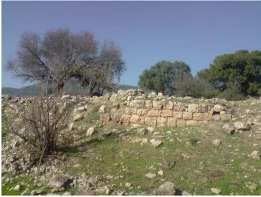
قرية الفراضية المهجرة