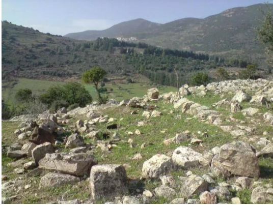
قرية الفراضية المهجرة