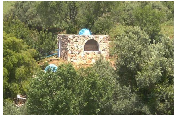
الفراضية: هذا مقام الشيخ منصور