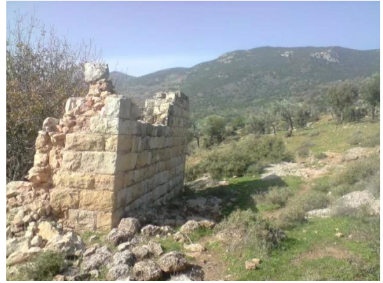
اثار البيوت في قرية الفراضية