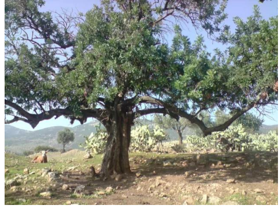
الفراضية: Carob tree on the southern side of the village شجرة خروب شامخة في الناحية الجنوبية للقرية