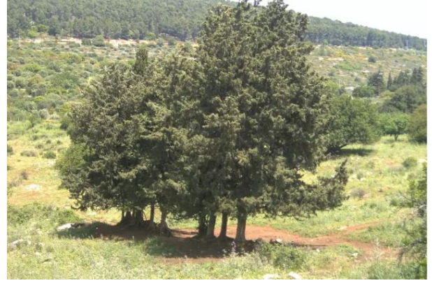
الفراضية: اشجار الصنوبر شاهدة على العصر فراضية