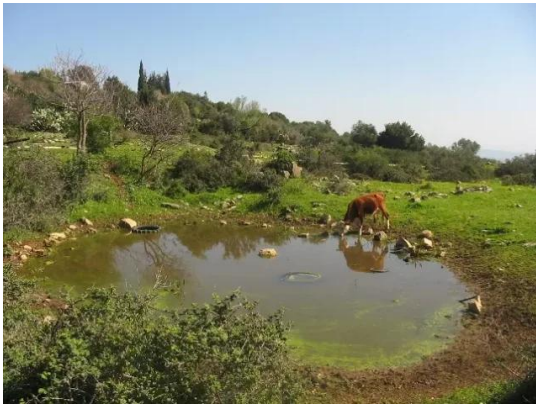
الفراضية: تجمعات لمياه المطر في اطراف القرية - 28/2/2005