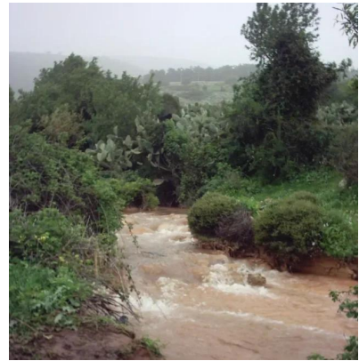
الفراضية: نهر موسمي يسمى الرميطة ينبع من جبل الجرمق , ثم الى السموعية والى وادي فراضية ثم الى كفر عنان 2003