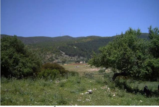
الفراضية: منظر عام للقرية - وقوفاً شمالي القرية عند الصعود الى منطقة جبل الجرمق - ربيع 2003