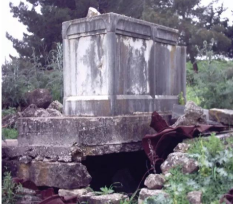
الفراضية: مقبرة القرية , أحد القبور الواضحة (خشخاشة) 2003