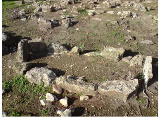
الفراضية: A tomb in the cemetery بقايا قبر في المقبرة في الجهة الشرقية للقرية