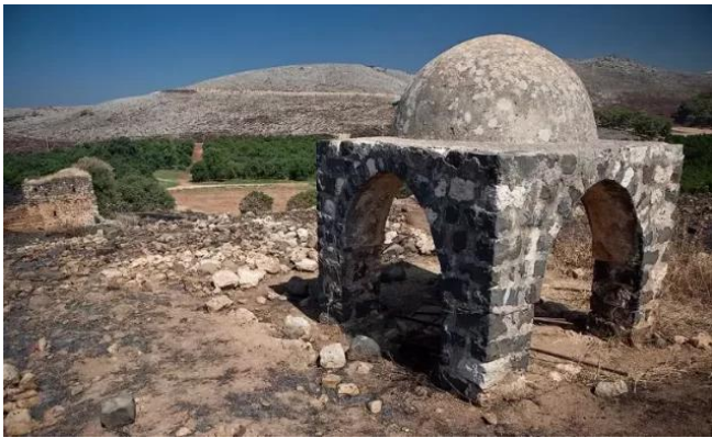
جب يوسف: بئر يوسف