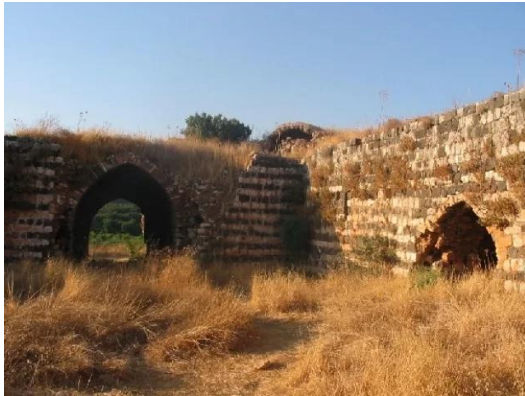
جب يوسف: الساحة الداخلية للخان