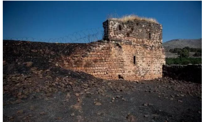
جب يوسف: خان القرية