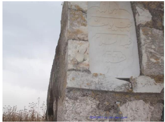
جب يوسف: لوحة الرخام على جب يوسف