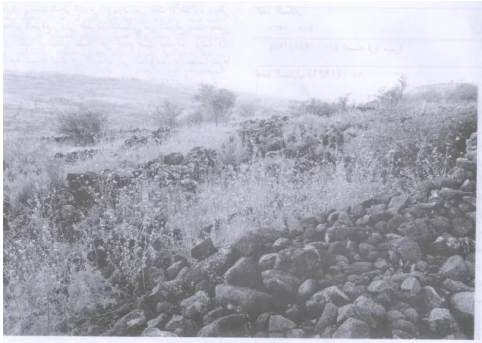
منظر إلى الشمال الغربي من الطرف الجنوبي الشرقي للموقع (أيار/مايو ١٩٩٠) [البلطجة]