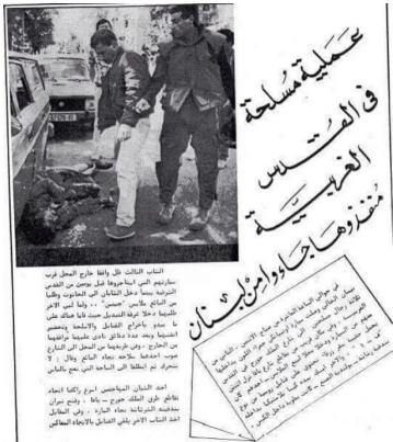
عملية يوم القدس